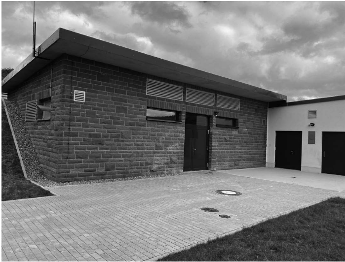
Neues Wasserwerk des Marktes Eschau, welches im November 2023 in Betrieb genommen wurde.