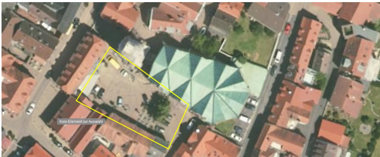
Parkplatz Rathaus / Kirchplatz am Stiftshof