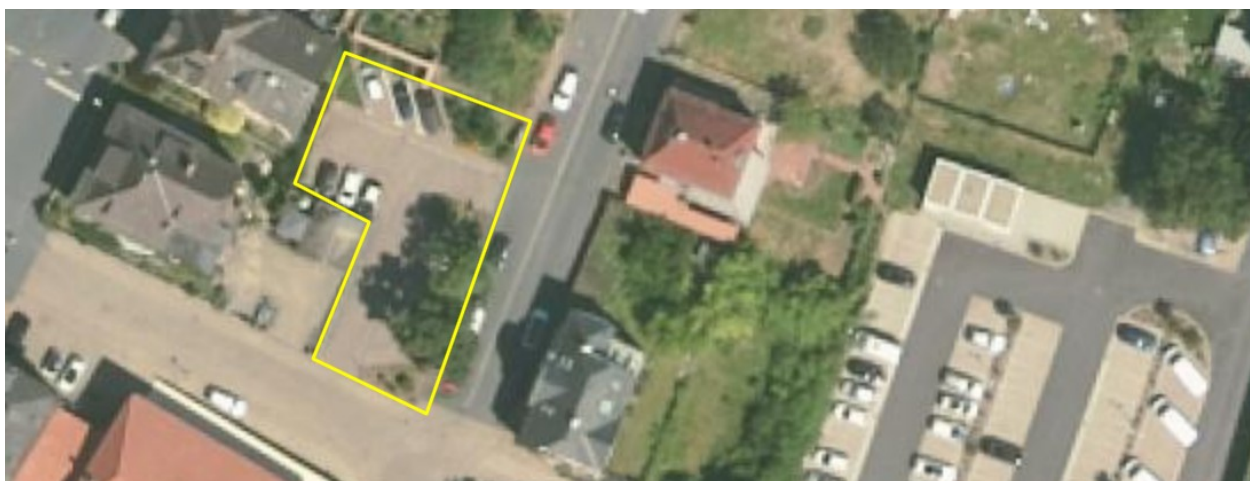
Parkplatz Frühlingstraße Ecke Römergässchen