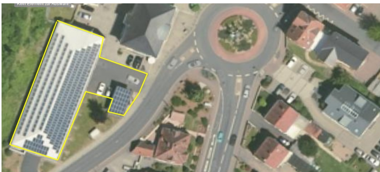
Parkhaus Wendelinuskreisel, der Öffentlichkeit zugänglichen und nutzbaren Bereichen, einschl. der unteren Zufahrt ins Parkhaus vorgelagerter Parkflächen