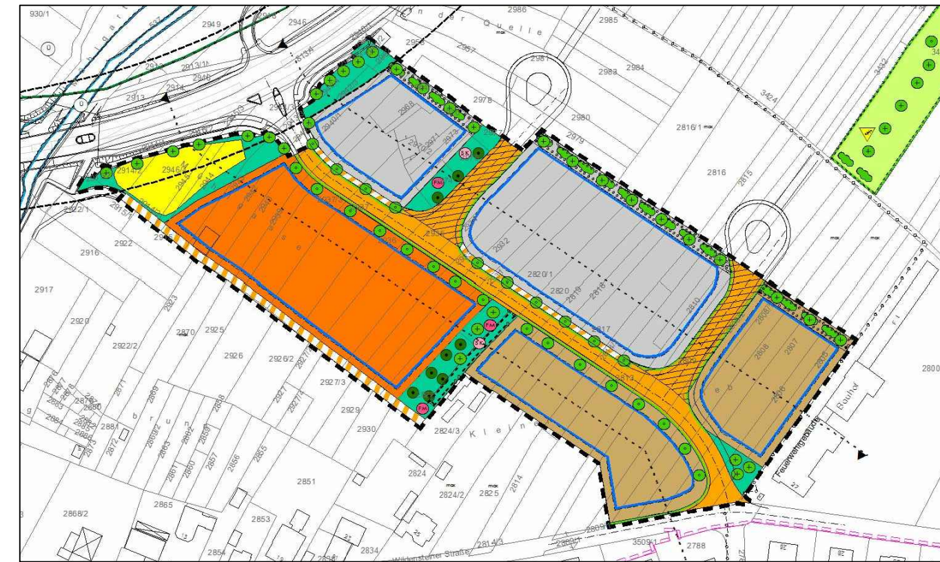
Schnittführung im Bebauungsplan "Quelle" (unmaßstäblich)