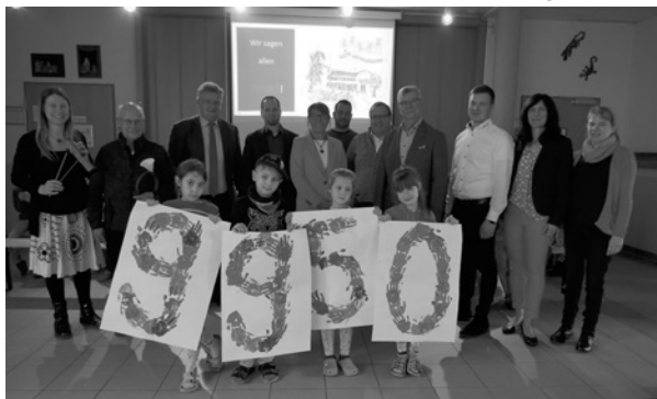
Foto: Valentin-Pfeifer-Grundschule in Eschau Sponsoren und die Schulleitung freuen sich über den Start des WIM-Projektes

Weitere Informationen zum WIM-Projekt finden Sie unter www.bmh.de/projekte/wim/