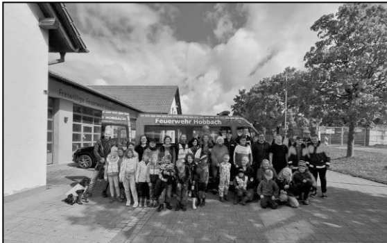
Die Teilnehmer der Flursäuberungsaktion in Eschau

Am Samstag, 17. September 2022, beteiligte sich auch der Markt Eschau an der landkreisweiten Aktion „Saubere Flur“ statt. Insgesamt haben 38 Teilnehmer im Alter zwischen vier und 65 Jahren (davon allein 17 Kinder) mitgewirkt. Start war 09.00 Uhr an der Elsavahalle Eschau bzw. am Feuerwehrhaus Hobbach. In Eschau gab es zwei Gruppen. Eine Gruppe lief Richtung Schutzhütte, die weitere Gruppe Richtung REWE-Markt und Radweg Richtung Unteraulenbach. Die FFW Hobbach säuberte den Fahrradweg ab Festhalle Richtung Heimbuchenthal bis zum Höllhammer. Nach Ende der Aktion gegen 11:30 Uhr trafen sich alle Gruppen zentral am Feuerwehrhaus Eschau, wo es für die fleißigen Helfer Getränke und frisch belegte Brötchen vom Metzger zur Stärkung gab. 1. Bürgermeister Gerhard Rütth bedankte sich bei allen Mitwirkenden der Aktion Flursäuberungsaktion 2022.