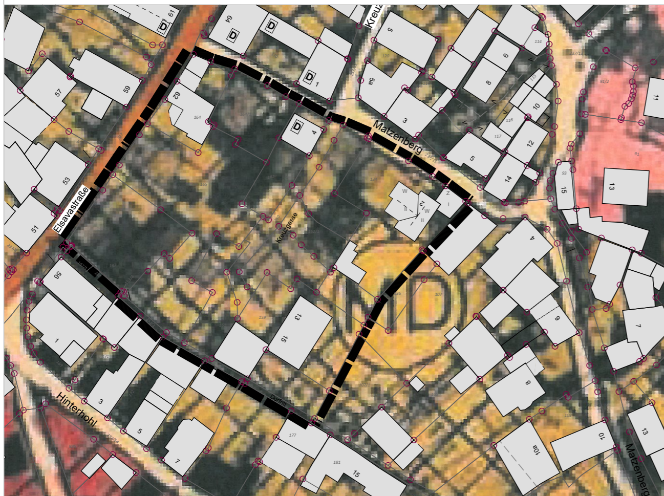
Ausschnitt aus der aktuellen Fassung des FNP des Marktes Eschau mit Kennzeichnung des Geltungsbereichs